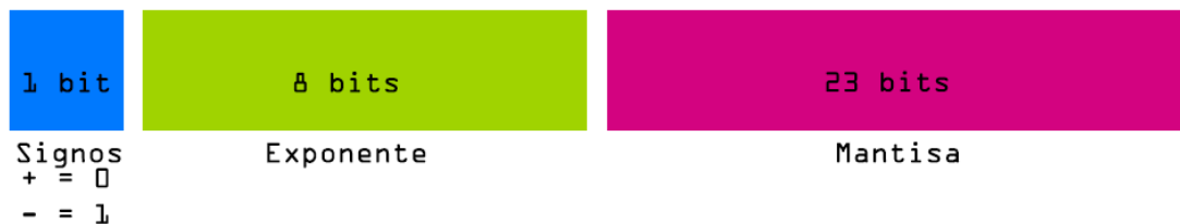
Imagen 1: Estructura formato IEEE 754 en memoria de computador de 32 bits.

Completando de esta manera treinta y dos (32) bits en memoria de computador.